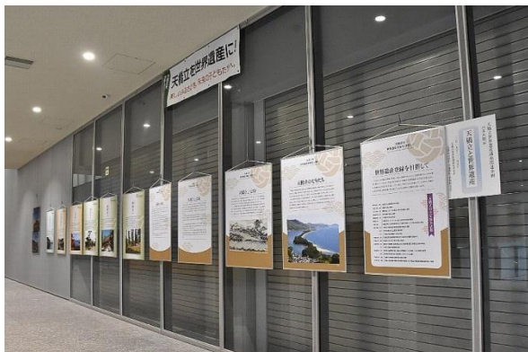
パネル展示の様子