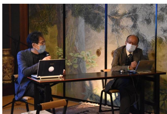
パネルディスカッション